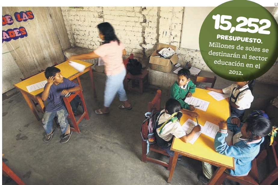
El gasto anual por alumno en educación inicial en Perú ascendió a S/. 1,358 en el 2010, según el MEF.

Un estudio del Banco Interamericano de Desarrollo (BID) ha determinado que la baja calidad en la educación, sumada a la falta de estímulos educativos y emocionales para continuar con los estudios, hacen que las adolescentes opten por embarazarse como una forma de escapar del deficiente sistema educativo y con la expectativa de tener una vida mejor y diferente. La investigación del BID “El fracaso educativo: Embarazos para no ir a clase”, que se realizó en Perú y en Paraguay, reveló que las madres adolescentes abandonaron la escuela porque tenían pocas aspiraciones para su futuro y porque no creían poder transformar su propia existencia por medio de la educación, porque es muy mala. Es más, algunas jóvenes buscaron la maternidad para evitar ir a la escuela.